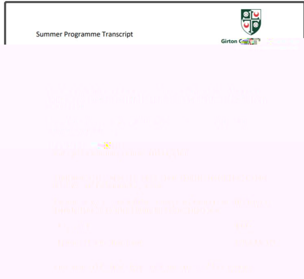
图：剑 大 学 书 与 单 图